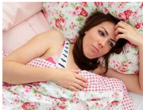
Grundregel für gutes Schlafen: erst zu Bett gehen, wenn man wirklich müde ist.

Viele Betroffene können sich selbst helfen, denn oft ist eine verbesserte Lebensweise der Weg zur geruhsamen Nacht.